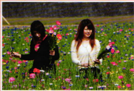
ひなげし・矢車草