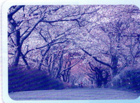
伏倉上手の桜のトンネル