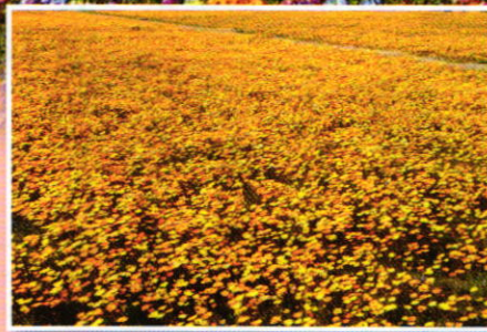
アフリカキンセンカ (3月上旬~4月上旬)