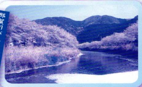
那賀川バイパス沿いの桜並木