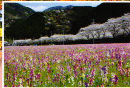
るりからくさ・姫金魚草 (3月中旬~4月中旬) つましろひなぎく (4月上旬)