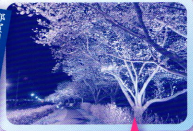
那賀川バイパスライトアップ