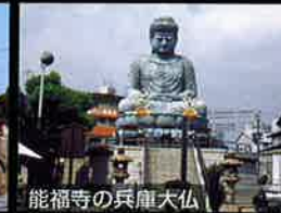
能福寺の兵庫大仏