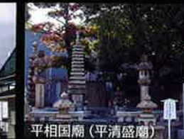
平相国廟(平清盛廟)