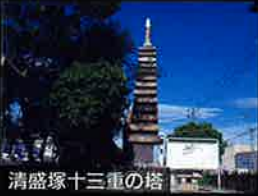
清盛塚十三重の塔